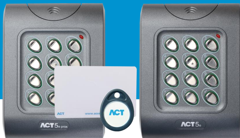
ACT 5e prox Digital knappsats & beröringsfri läsare

Knappsatserna har ett elegant polykarbonathölje med knappar i rostfritt stål och integrerad elektronik vilket gör det möjligt att använda dem både inomhus och utomhus.