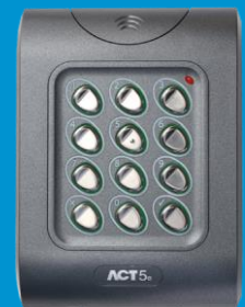
ACT 5e digital knappsats