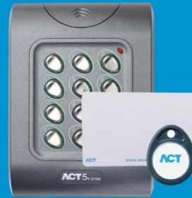
ACT 5e prox Digital knappsats & beröringsfri läsare