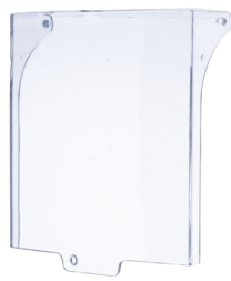
EM301LS-COVER Reservdel: Lock