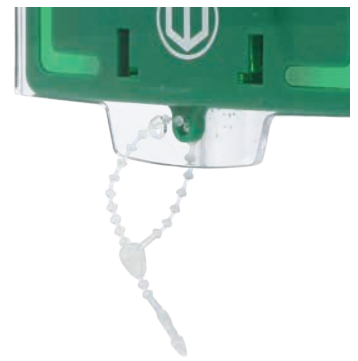
EM-COVERSTRAP Plomberingstråd till EM301